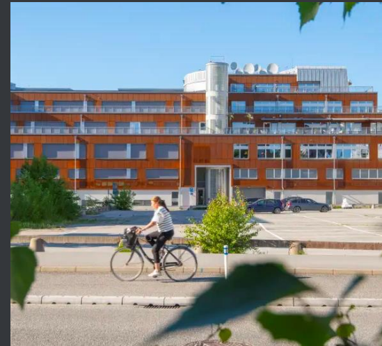
The Rotterdam District, vinnare i SGBC Awards