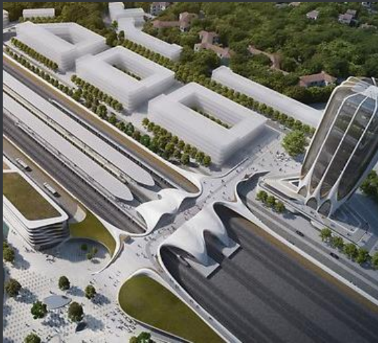
Väsby Entré - ny hållbar stadsdel i Stockholm