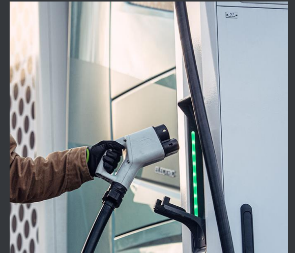
Laddstationer längst E20 för grön omställning