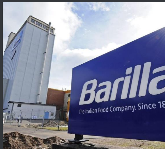
Modernisering och utbyggnad av Barillafabrik